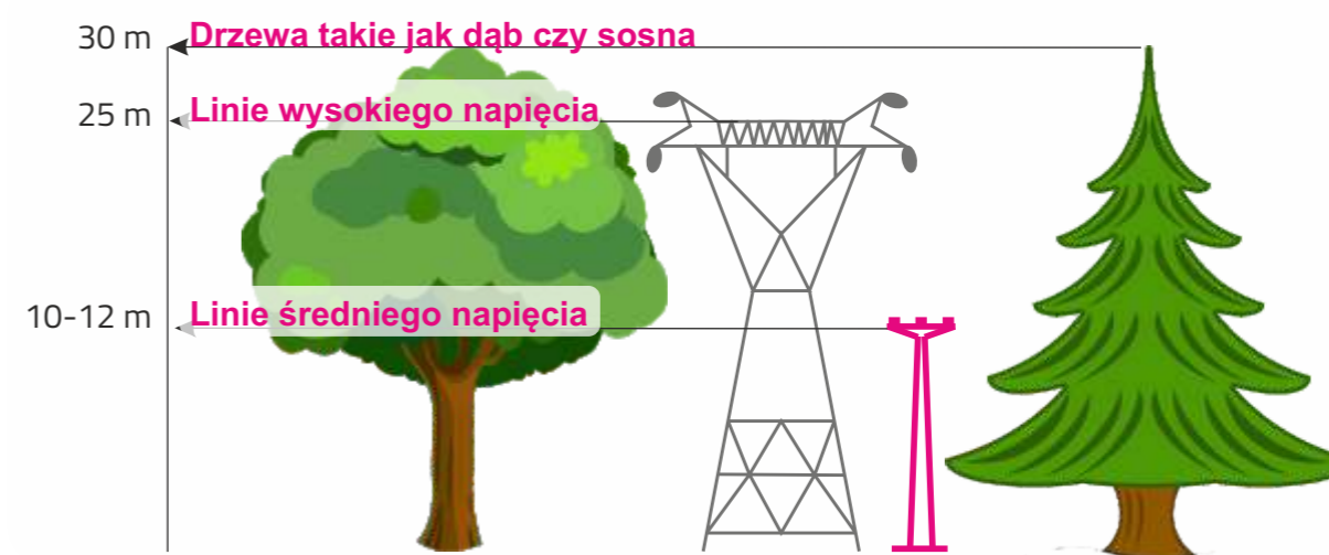
Wysokość słupów a wysokość drzew

DOWIEDZ SIĘ JAK BEZPIECZNIE SADZIĆ DRZEWA W POBLIŻU LINII I SŁUPÓW ENERGETYCZNYCH